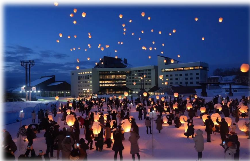
空飛ぶランタンの宿