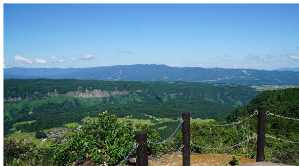
苗場山麓ジオパーク ニュー・グリーンピア津南展望台